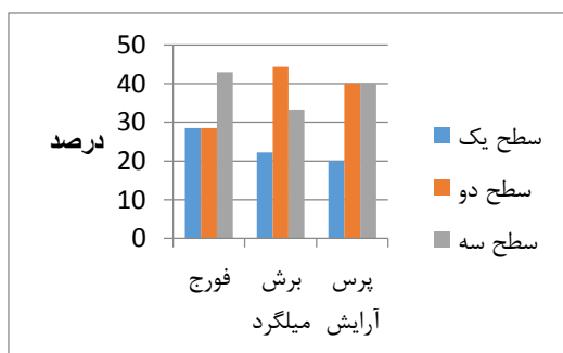
شکل ۲- نمودار درصد سطوح مختلف ریسک در سه شغل مورد بررسی بر اساس روش ویلیام فاین

همچنین ارزیابی ریسک با استفاده از روش ویلیام فاین نیز جهت بررسی دقیق تر و تکمیل ارزیابی ریسک در این سه شغل صورت گرفت. نتایج حاصل از ارزیابی ریسک به روش ویلیام فاین در هر سه شغل مورد بررسی در نمودار شکل ۲ قابل مشاهده است. در این نمودار درصد سطوح مختلف ریسک در هر سه شغل مورد بررسی بیان شده است.