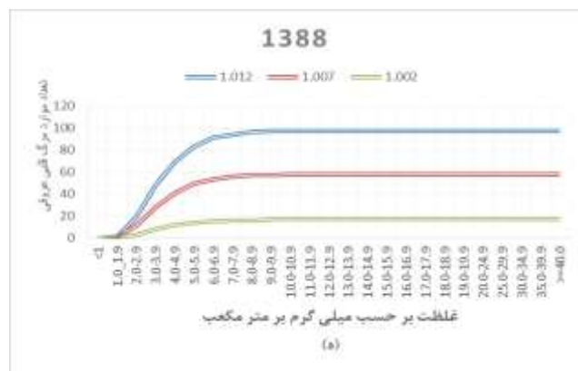
شکل ۱- رابطه تعداد تجمعی موارد مرگ قلبی عروقی ناشی از CO در برابر فواصل غلظت در سالهای ۸۸-۸۴