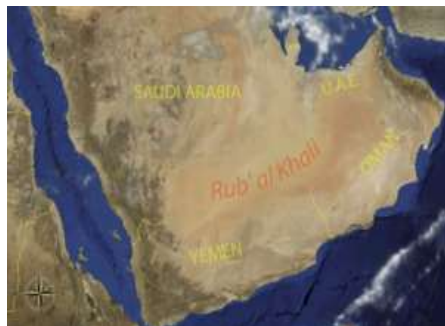
شکل ۲. موقعیت منطقه ربع الخالی در خاورمیانه

طوفانهای خاورمیانه عمدتاً بر سه نوع مختلف شمال، جبهه ای و همرفتی تقسیم می شود. اصلی ترین نوع این طوفان ها، نوع شمالی آن است که بر روی عراق، کویت و شبه جزیره عربستان اتفاق می افتد (۱۷). طی سالهای اخیر طوفان های گرد و غبار در خاورمیانه و به خصوص در صحرای عربستان و عراق اثرات زیانبار زیادی را برای کشورمان به همراه داشته که دامنه آن تا شهرهای عمده کشیده شده است. تحلیل جریانات و بررسی های تصاویر ماهواره ای منطقه خاورمیانه، نشان می دهد که صحرای ماسه ای جهان به نام "ربع الخالی" به علت عاری بودن از پوشش گیاهی و خشکسالی های اخیر، یکی از چشمه های بروز پدیده گردوغبار در این منطقه خاورمیانه می باشد که در کشورهای عربستان سعودی، یمن، عمان و امارات متحده عربی استقرار یافته است (۱۸). شکل (۲) منطقه ربع الخالی و موقعیت آن در خاورمیانه را نشان میدهد.