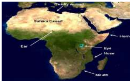
شکل ۱. بیابان ساهارا و موقعیت آن در آفریقا