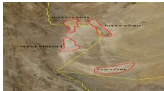
شکل ۴. موقعیت دریاچه جازموزیان در استان سیستان و بلوچستان

شرق ایران و منطقه سیستان به علت وجود دریاچه بزرگ نمک خشک (هامون) و دلتای رودخانه هیلمند، عمدتاً محلی می باشد (۲۷). تفسیر تصاویر ماهواره ای نشان میدهد که عمده ترین محل برداشت و مرکز طوفان ها بر روی دریاچه هامون ساپوری به دلیل نزدیکی به کشور افغانستان قرار دارد و پس از آن هامون پوزک و هامون هیرمند در درجات بعدی اهمیت قرار می گیرند (شکل ۴) (۲۸).