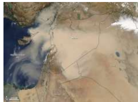
شکل ۳. منشأ ریزگردهای مناطق خاورمیانه در سال ۲۰۱۵

بیشترین تکرار را دارند. این طوفان ها در غرب عراق و سوریه، اردن، لبنان، شمال عربستان سعودی و جنوب مصر بیشتر در بهار رخ می دهند. در حالیکه در جنوب اسرائیل و نواحی مدیترانه ای شمال مصر در بهار و زمستان اتفاق می افتند (۱۹). شکل ۳ نشان دهنده تصاویر ماهواره ای از این مناطق می باشد. طبق مطالعه ای که توسط Kutiel بر روی طوفانهای گردوغبار در خاورمیانه انجام شده است، نشان میدهد که کشورهای ایران، سودان، عراق، عربستان سعودی و تمام کشورهای حوزه خلیج فارس در دسته اول، قرار میگیرند که نشانگر بالاترین فراوانی وقوع طوفانهای گردوغبار در منطقه مورد مطالعه است. مطالعه همچنین بیانگر این واقعیت است که فراوانی وقوع طوفانها در این کشورها طی دوره گرم سال بیشتر است (۲۰).