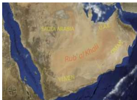
شکل ۲. موقعیت منطقه ربع الخالی در خاورمیانه

طوفانهای خاورمیانه عمدتاً بر سه نوع مختلف شمال، جبهه ای و همرفتی تقسیم می شود. اصلی ترین نوع این طوفان ها، نوع شمالی آن است که بر روی عراق، کویت و شبه جزیره عربستان اتفاق می افتد (۱۷). طی سالهای اخیر طوفان های گرد و غبار در خاورمیانه و به خصوص در صحرای عربستان و عراق اثرات زیانبار زیادی را برای کشورمان به همراه داشته که دامنه آن تا شهرهای عمده کشیده شده است. تحلیل جریانات و بررسی های تصاویر ماهواره ای منطقه خاورمیانه، نشان می دهد که صحرای ماسه ای جهان به نام "ربع الخالی" به علت عاری بودن از پوشش گیاهی و خشکسالی های اخیر، یکی از چشمه های بروز پدیده گردوغبار در این منطقه خاورمیانه می باشد که در کشورهای عربستان سعودی، یمن، عمان و امارات متحده عربی استقرار یافته است (۱۸). شکل (۲) منطقه ربع الخالی و موقعیت آن در خاورمیانه را نشان میدهد.