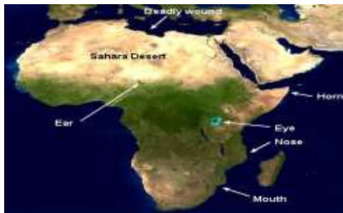
شکل ۱. بیابان ساهارا و موقعیت آن در آفریقا