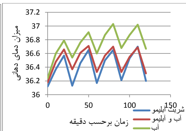
شکل ۲: تغییرات ضربان قلب فعالیت، دمای دهانی و دمای پوست حین فعالیت و نوشیدن مداخله گرها