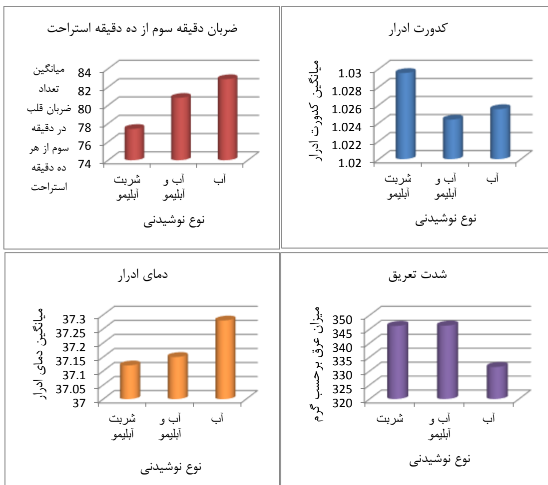
شکل ۱: تغییرات شدت تعریق، ضربان قلب در دقیقه سوم از هر ده دقیقه استراحت، دمای ادرار و کدورت ادرار حین فعالیت و نوشیدن مداخله گرهای

قلب در حالت استراحت ( دقیقه سوم از هر ۱۰ دقیقه استراحت) در سه شرایط مداخله تفاوت معناداری را نشان داد ( p=0/04 ). آزمون آنالیز واریانس با تکرار مشاهدات نشان داد که میانگین دمای دهانی ( p=0/007 ) و میانگین دمای پوست ( p=0/005 ) دارای تفاوت معنا دار تحت شرایط مصرف ۳